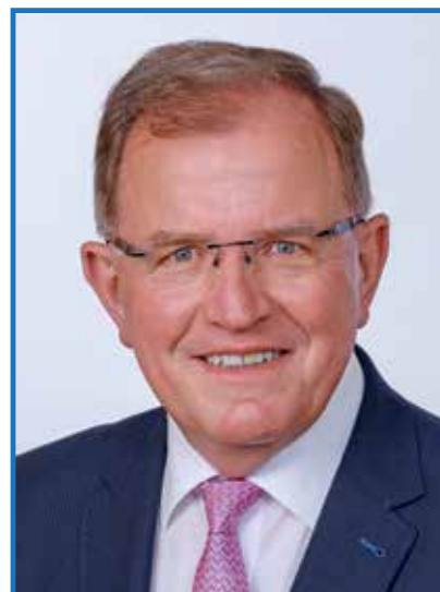
Erwin Dotzel Präsident des Bezirkstags Unter-Franken